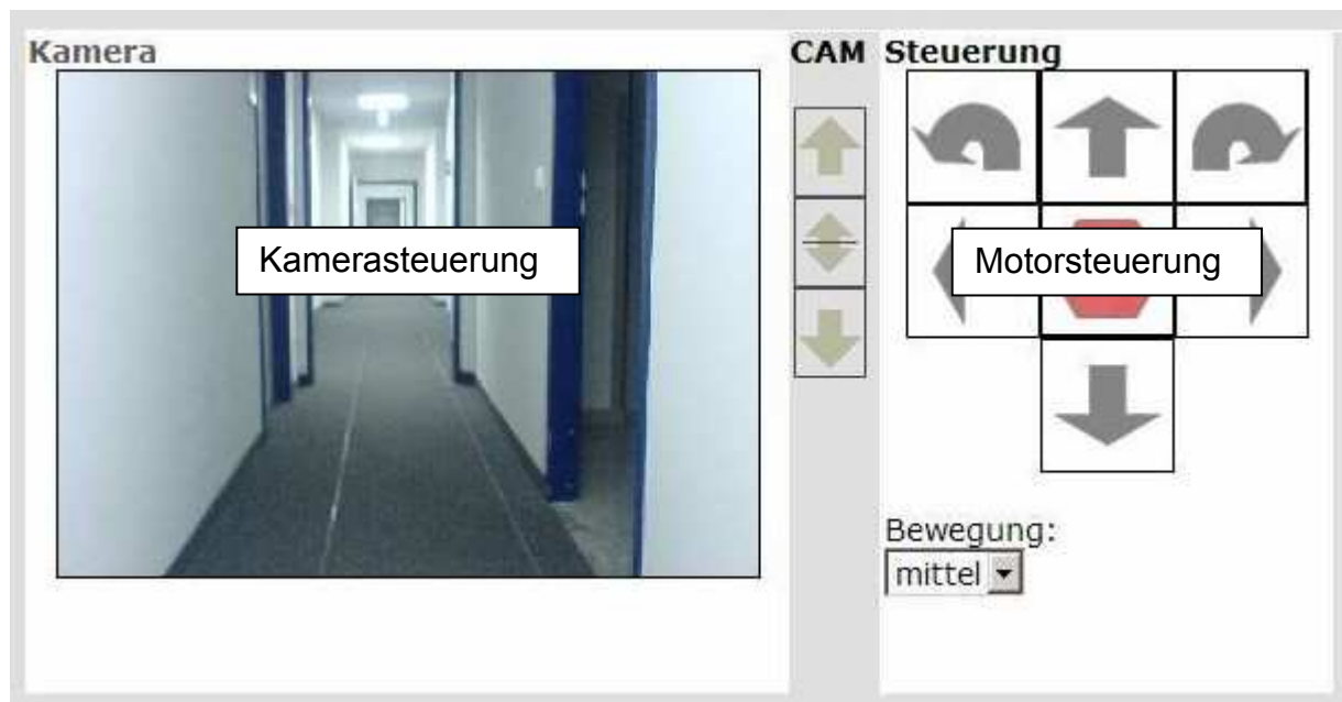
Abb. Websteuerung mit Feldern für Motor, Video und Weiteres

Die Websteuerung ist in Felder bezogen analog zu den einzelnen Aktoren des Roboters unterteilt.